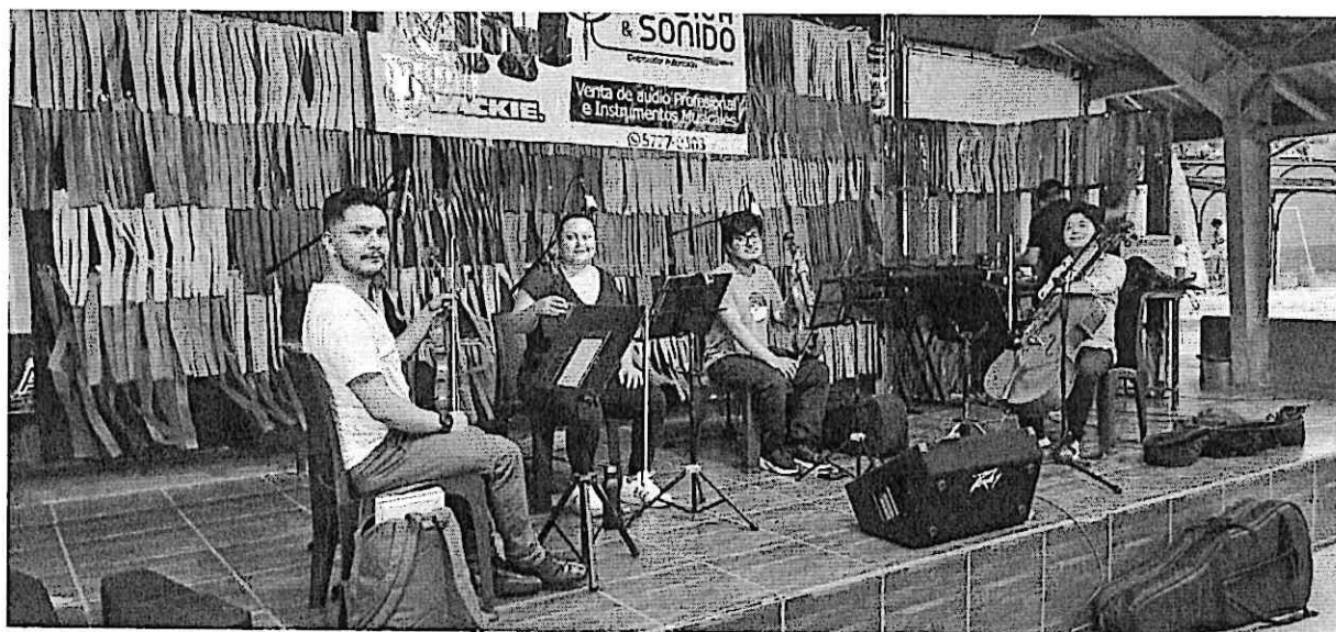
Cuarteto Primavera probando sonido previo al concierto en Zacapa