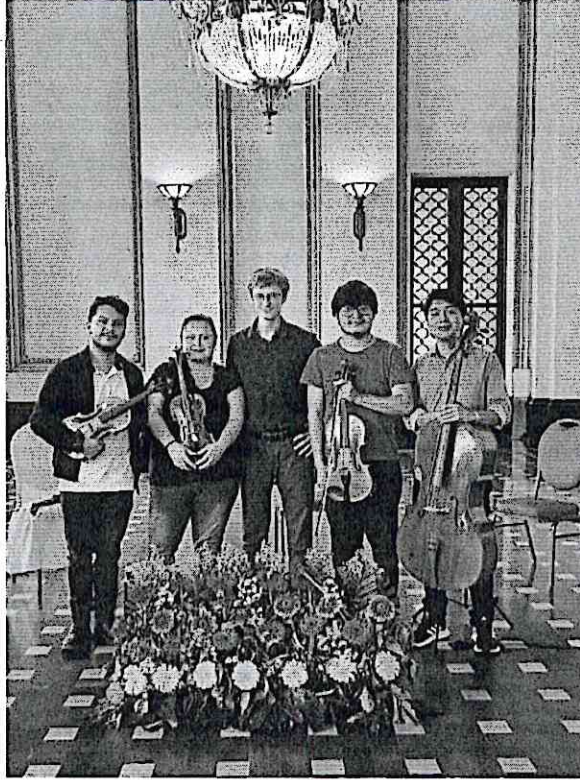
Ensayo público en el Palacio de la Cultura con el solista francés Frédéric Pelassy