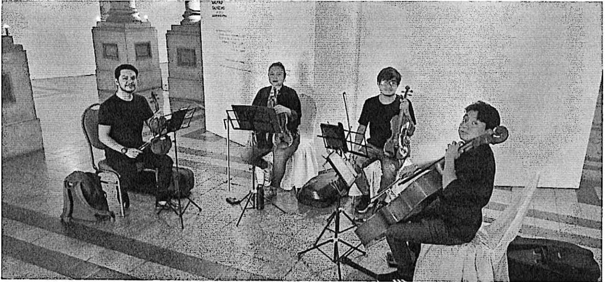
Ensayo público del cuarteto en el Palacio de la Cultura