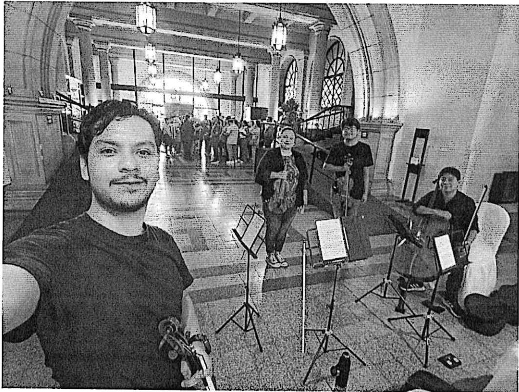
Cuarteto Primavera durante ensayo en el Palacio de la Cultura