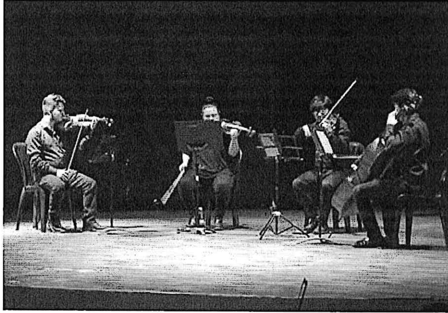
Cuarteto Primavera durante el taller con los alumnos del conservatorio Regional de Música "Eulalio Samayoa"