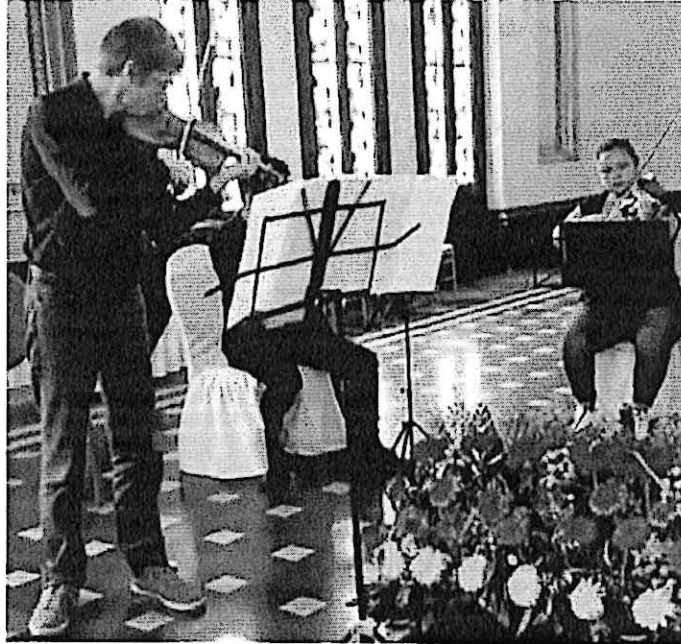
Ensayo en el Palacio Nacional junto al maestro violinista Frédéric Pelassy