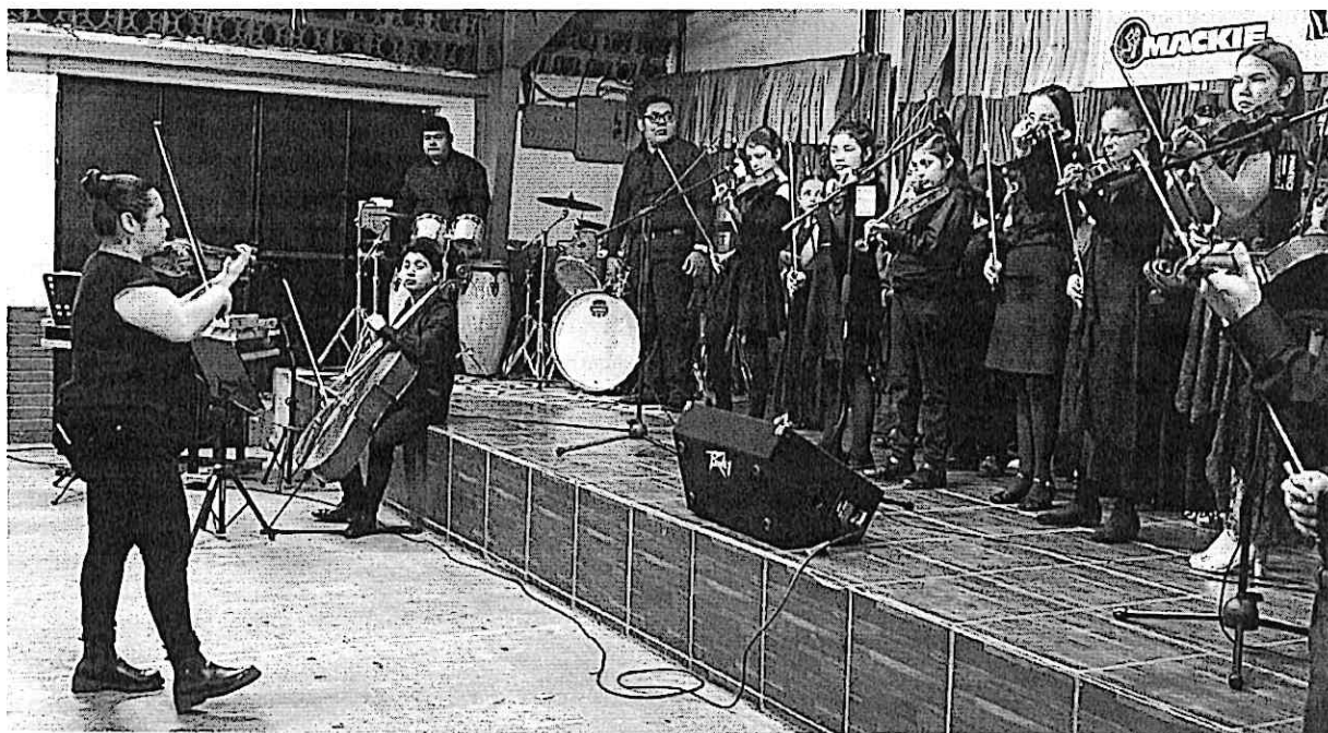
Cuarteto Primavera durante la presentación con los alumnos del conservatorio