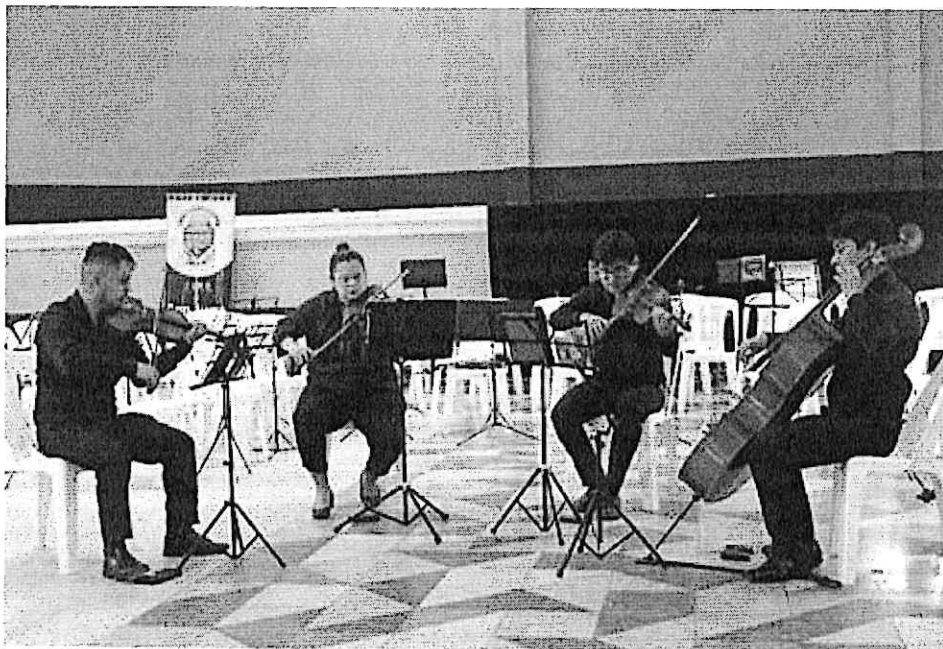
Cuarteto Primavera durante la presentación en el Salón "El Jocoteco"