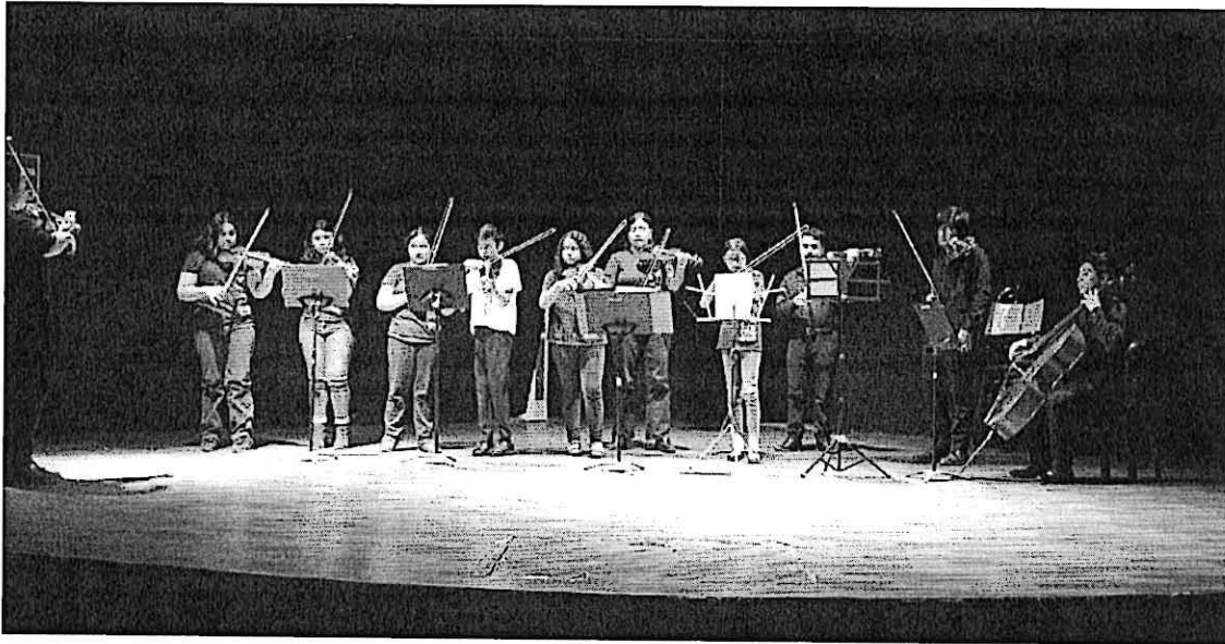
Cuarteto Primavera y estudiantes avanzados del Conservatorio Regional de Música "Eulalio Samayoa"