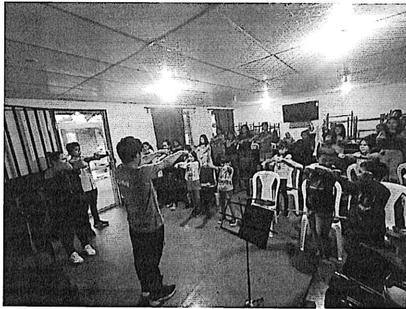
Cuarteto Primavera y estudiantes de la orquesta juvenil de Zacapa durante el taller

Los talleres se realizaron de 15:00 a 18:00h y estuvieron dirigidos a los jóvenes estudiantes de la Orquesta Juvenil de Zacapa y de Chiquimula, quienes participaron con mucho entusiasmo y dedicación. Estas actividades culminaron en un ensamble conjunto con el Cuarteto Primavera, reflejando el compromiso y el interés de los músicos jóvenes por mejorar su técnica y su desempeño instrumental. Más tarde, a las 19:00h, se llevó a cabo un concierto en el Colegio Luterano, donde el público disfrutó de un variado repertorio que incluyó música latinoamericana, nacional y centroeuropea. Los asistentes valoraron especialmente las piezas de origen nacional y latinoamericano, y también mostraron gran interés por las obras centroeuropeas y la colaboración entre los estudiantes y el cuarteto.