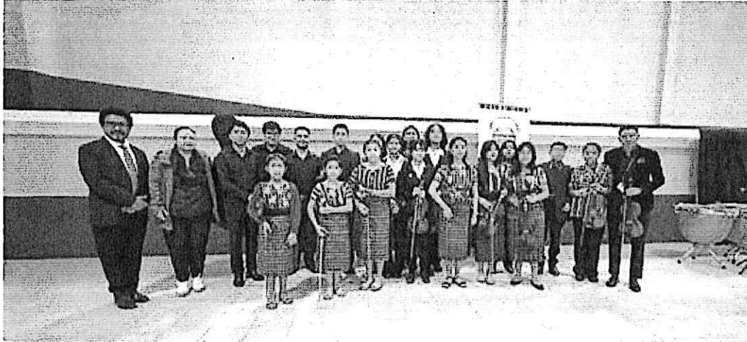
Director y alumnos de la Escuela Elemental de Música "Elías García" junto al cuarteto.