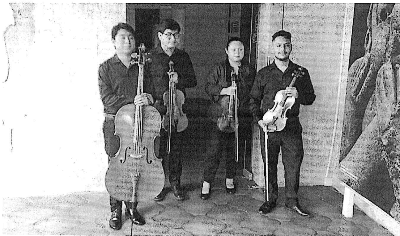
Cuarteto Primavera en el Museo Nacional de Arte de Guatemala (MUNAG)