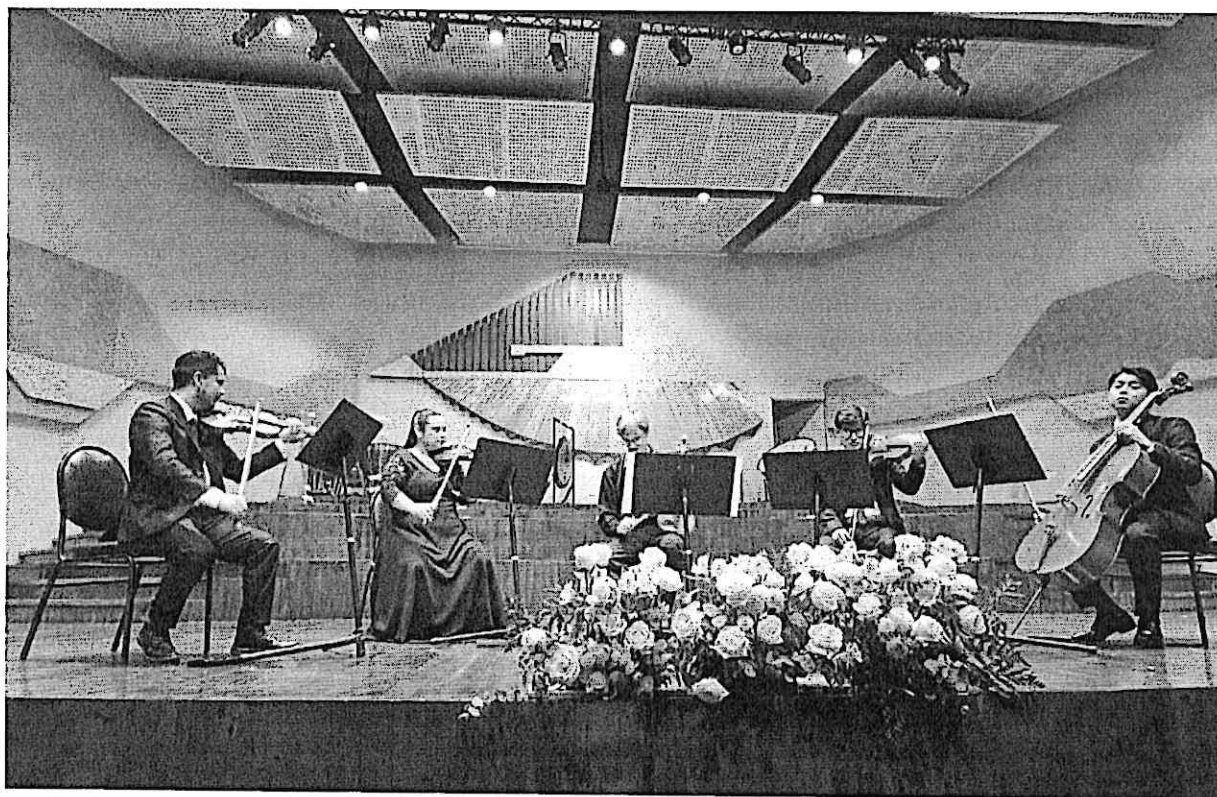
Cuarteto Primavera junto al maestro francés Frédéric Pelassy

El concierto culminó de manera inolvidable con la interpretación conjunta de la emblemática obra Luna de Xelajú de Francisco Pérez. Este ensamble final combinó la calidez del Cuarteto Primavera con la expresividad del violinista Pelassy, ofreciendo una interpretación conmovedora que celebró la belleza y el legado de la música guatemalteca en una fusión artística única.